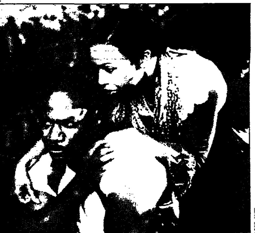
فيخ ويس واليزابيث تايلور في مشهد من فيلم روزود لشركة وورلد